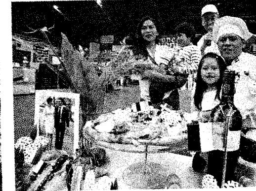
Pizza Alcune immagini delle gustose sfide, ieri all'interno del palasport salsese.